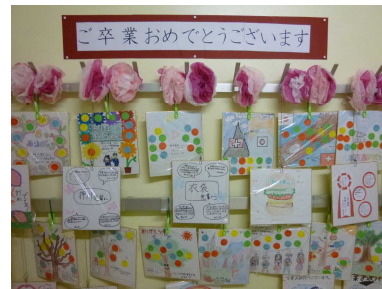
小中の在校生が贈った寄せ書き